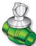
18VCI2 Valvola a sfera compatta con maniglia a 3 punte Built-in ball valve with handle Vanne à bille avec poignée Válvula de bola con manija