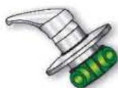
18MD1 Miscelatore doccia con cartuccia ø 40 Shower mixer with cartridge ø 40 Mixer avec cartouche ø 40 Mixer ducha con cartucho ø 40