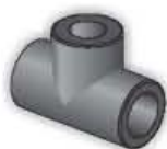
14TE Derivazione a T 90° 90° tee Té à 90° Te 90°