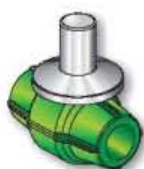
18VCI1 Valvola a sfera compatta con cappuccio Built-in ball valve with cap Vanne à bille avec capuchon Válvula de bola con capucho