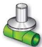
18RA Rubinetto d'arresto Stop cock Robinet d'arrêt à capuchon Grifo de cierre