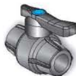
18VC Valvola a sfera compatta in PP-R PP-R Ball Valve Vanne à bille en PP-R PP-R Válvula de bola