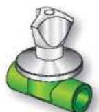
18RT Rubinetto d'arresto prolungato con maniglia Extended stop cock with handle Robinet d'arrêt prolongé avec poignée Grifo de cierre prolongado con manija