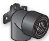
16GZ Gamito terminale a 90°_fil. fem. 90° end elbow female thread Coude à 90° taraudé avec étrier Codo terminal 90° rosca hembra