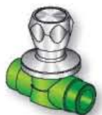
18VS2 Valvola a sfera con pomello Ball valve with knob Vanne à bille avec pommeau Válvula de bola con pomulo