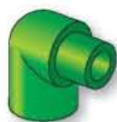
16GP Gomito a 90° M-F 90° M-F elbow Coude à 90° M-F Codo 90° M-H