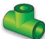
14TR Derivazione a T 90° ridotta 90° reducing tee Té à 90° réduit Te 90° reducida