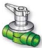
18VS3 Valvola a sfera con leva Ball valve with handle Vanne à bille avec poignée Válvula de bola con leva