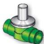
18VS1 Valvola a sfera con cappuccio Ball valve with cap Vanne à bille avec capuchon Válvula de bola con capucho